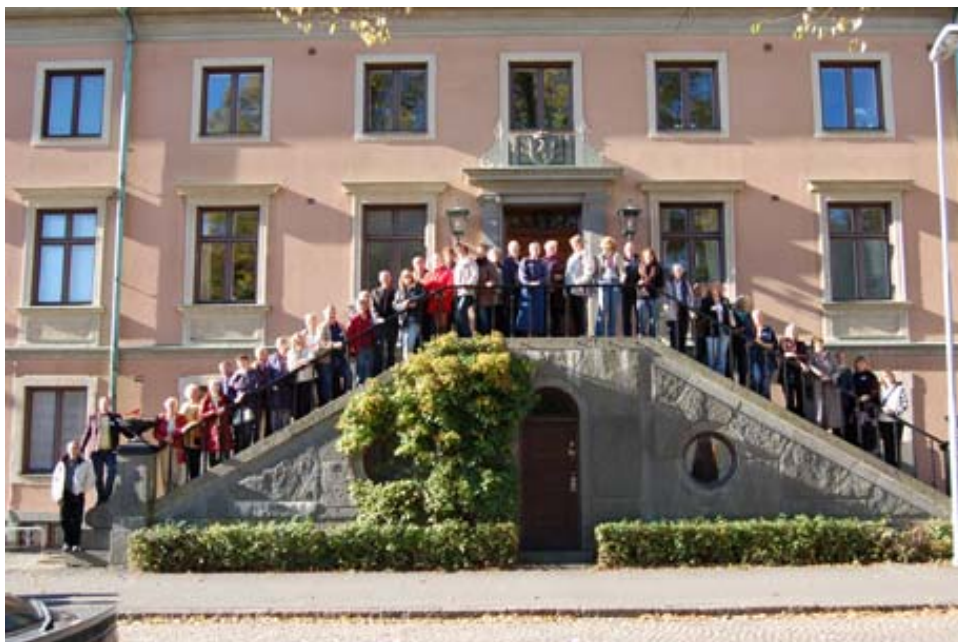
Regionkonferens i Skara

Svensk Trädgård har under år 2005 fortsatt att öka sitt medlemsantal och fem nya lokalföreningar har bildats. Hela 28 654 hushåll finns nu anslutna och de allra flesta i någon av de 179 aktiva och livaktiga lokalföreningarna runt om i landet. Det är inte utan att man fascineras av den idérikedom och kreativitet som finns och som rapporterats på de träffar som genomförts under året. Inte minst vid regionkonferenserna.