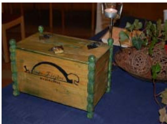
Årets förening 2004, Trädgårdsodlarna i Hudiksvall, har förslagslådan framme.

Vanliga och populära aktiviteter är trädgårdsvandringar, föredrag, utflykter, utställningar, växtbytdagar och studiecirklar. Tillfällen för gemenskap kring vårt intresse och ett stimulerande kunskapsutbyte. Aktiviteterna är förhållandevis välbesökta, vilket tyder på en lyhördhet när det gäller de enskilda medlemmarnas önskemål.