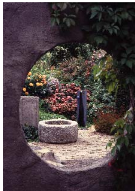
Tillsammans med Studieförbundet Vuxenskolan har bland annat en trädgårdsdesigncirkel sjösatts under designåret 2005 Trädgård att längta till