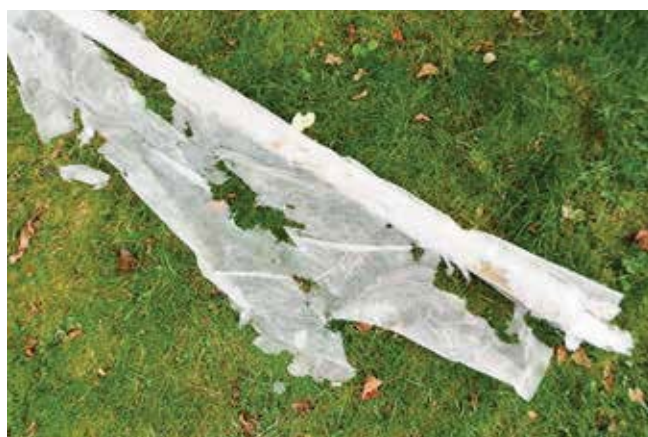
Fiberduk från Biltema som trasats sönder.

I försöket där dukarna exponerats ute under likvärdiga förhållanden var dukarna från Econova/Weibulls, Willab Garden/HPJ, Semenco och Weibulls Horto fortfarande hela efter 18 veckor. Duken från Nelson Garden fick det