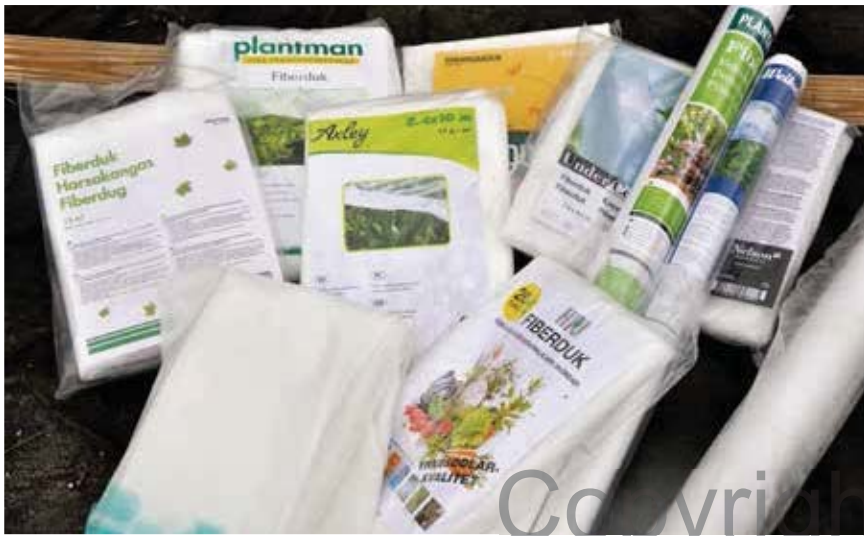
Fiberdukarna i sina förpackningar.

över hundra personer fick möjlighet att delta. Varje typ av fiberduk skickades till minst tio personer runtom i landet. Fiberduken skulle sedan användas i den egna trädgården under säsongen. Varje deltagare gjorde en rapportering om hur, till vad och hur länge duken använts och även en utvärdering av duken. Rap-