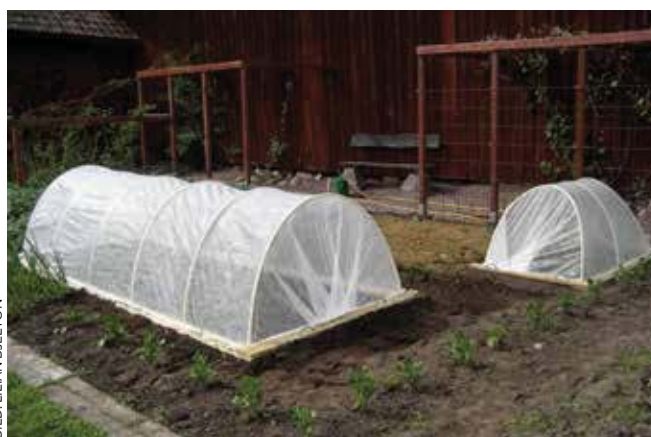
En tätt tillsluten fiberduk håller ohyran borta, men måste då hålla hela säsongen.