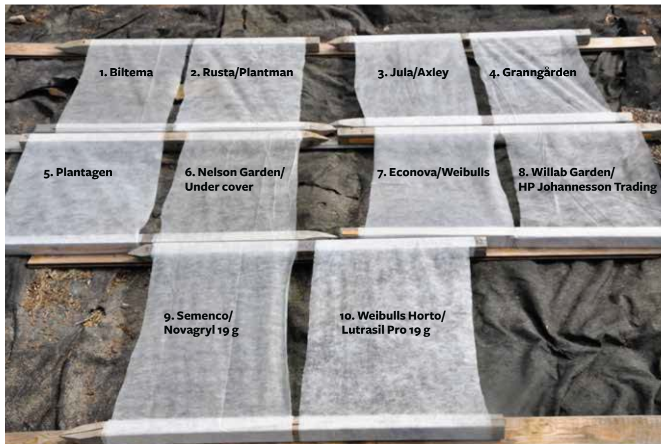
Alla fiberdukar utlagda i en trädgård i Mellansverige.

Intresset för att delta i spaningen var stort bland våra medlemmar och