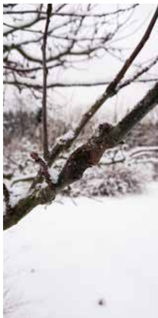
Äppelträd angripet av fruktträdskräfta.

SVAR: På bilden ser jag att det är fruktträdskräfta, Nectria galligena . Det är en vanligt förekommande skadesvamp på fruktträd och vissa lövträd, både i hemträdgård och offentliga planteringar. Sitter angreppet på en mindre gren, som i det här fallet, är det en fördel att ta bort den grenen. Den smittade grenen eldas sedan upp eller läggs i soporna, för svampsporer kan spridas från den angripna grenen under lång tid. Studier vid Sveriges lantbruksuniversitet, SLU, har visat, att sporer från fruktträdskräfta sprids redan vid fem plusgrader och under större delen av året. Sitter såret på en huvudgren eller på stammen, bör man skära rent det med en vass kniv, in på frisk ved, och sedan eventuellt behandla sårytan med sårvas eller lacbalsam, för att förhindra uttorkning av sårytan. Bortskurna bark- och vedrester ska eldas upp, då dessa kan sprida svampen. Rengör alltid redskapen efteråt med rödsprit, för att ta död på eventuella svampsporer. Nu har du gjort vad du kan för att motverka spridning till andra träd. För att undvika nya angrepp i ditt infekterade träd,