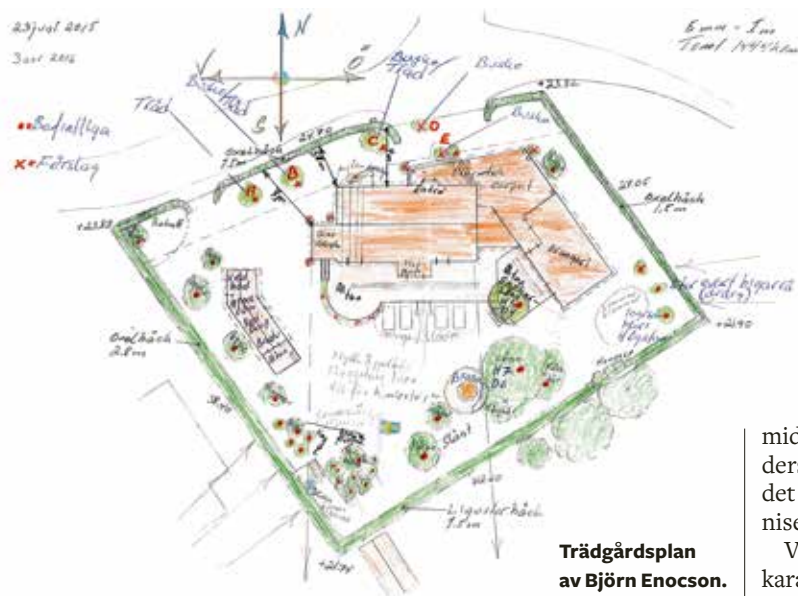
Trädgårdsplan av Björn Enocson.

Riksförbundet Svensk Trädgårds rådgivare svarar på dina frågor tisdagar, onsdagar och torsdagar kl 9–12, onsdagar dessutom kl 13–16. Ring 08-758 86 36 eller e-posta radgivning@tradgard.org