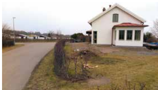
Entréträdgården sedd från väster.