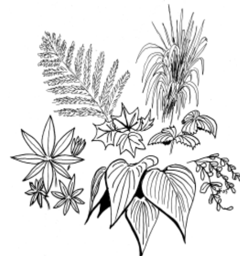
Det finns ett stort skönhetsvärde i olika bladverk. Använd gärna växter med vackra blad för att skapa variation i form och färg.

Har du en ritning över trädgården redan är det en bra utgångspunkt. Om inte, försök göra en egen uppmätning av ytan och utgå från den. Skissa därefter i stora drag hur du skulle vilja ha din trädgård med de olika rummen, vilka typer av "golv, väggar och tak" du vill avdela dem med, vilka slags växter du önskar. Om du inte hittar all växtinformation i de böcker du har så tveka