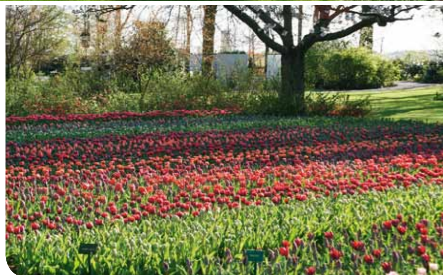
Keukenhof är de holländska lökodlarnas uppvisnings- och demonstrationsträdgård.

Är man i Holland med bil finns ytterligare en fantastisk anläggning värd att