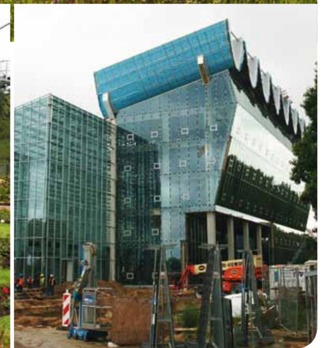
Nybygge inför Floriaden.

Flera föreningar ordnar resor till Floriaden. Om man inte har möjlighet att delta i en arrangerad resa är det inte lika enkelt, men Floriaden är ett stort evenemang. Det går att ta sig med tåg till Venlo som området heter, och parken ligger nära tyska gränsen, närmare Düsseldorf än Amsterdam och engelska fungerar utmärkt.